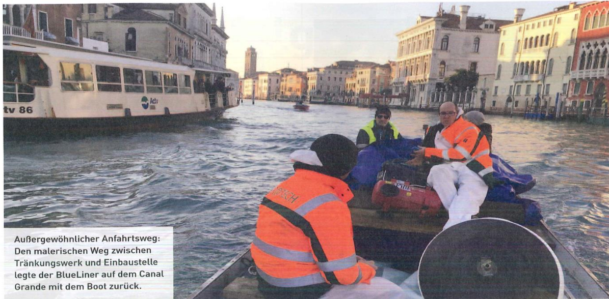
Außergewöhnlicher Anfahrtsweg: Den malerischen Weg zwischen Tränkwerk und Einbaustelle legte der BlueLiner auf dem Canal Grande mit dem Boot zurück.